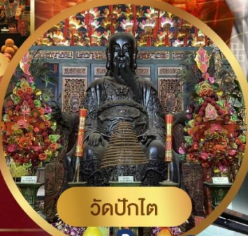
วัดปักโต