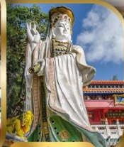
เจ้าแม่กวนอิม ริพลัสเบย์