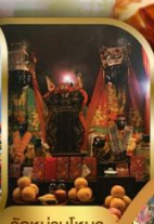
วัดบ้านใหม่