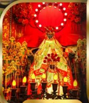
วัดเจ้าแม่กวนอิม ฮ่องซา