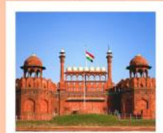
♥♦♦ Agra Fort