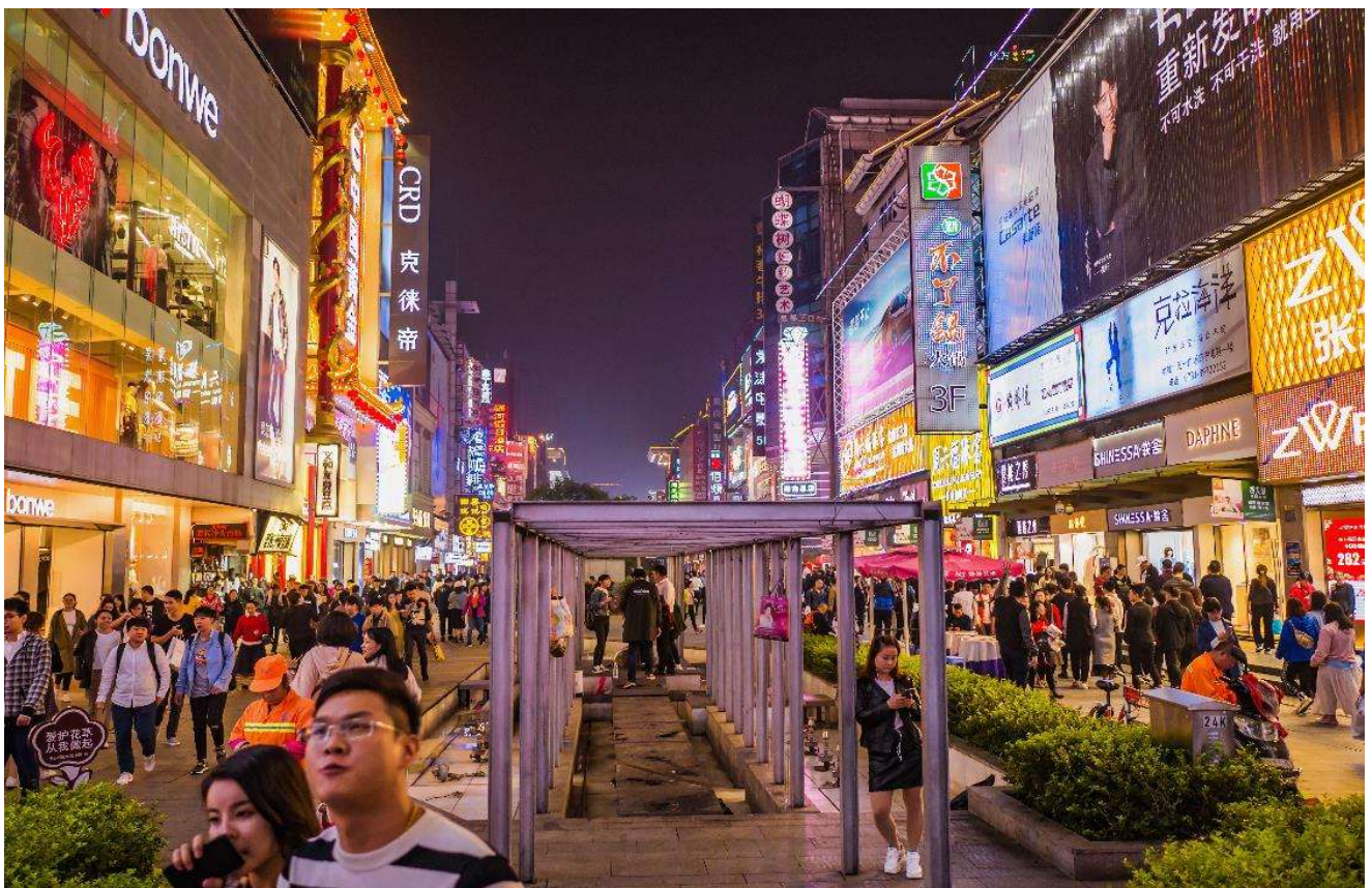
T2G-CSX16SL ZhangJiajie...ฉางซา จางเจียเจีย ฟู่หลงเจิ้น เฟิ่งหวง สะพานแก้ว 6D 5N (SL)