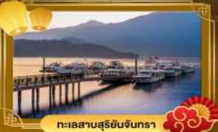
ทะเลสาบสุริยจันทร์