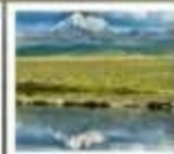
ดวงตาแห่งต่างทิ่