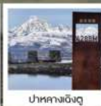
ป่ากลางเฉิงตู