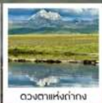
ดวงดาวหิ่งถ้ำก่าง