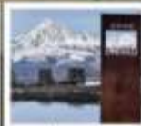
ป่าทางเฉิงตู