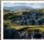
สวนหินปาเหมย์