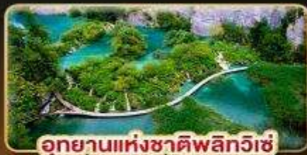
อุทยานแห่งชาติพลิตวิเช