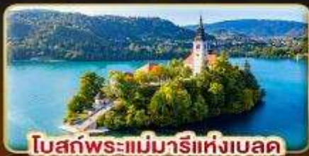
โบสถ์พระแม่มารีย์แห่งเบลด