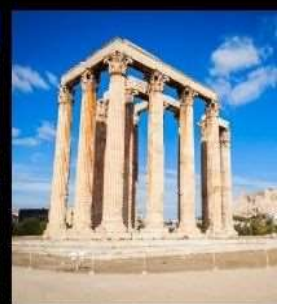
Temple Of Olympian