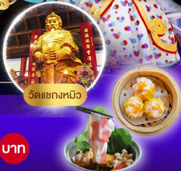
วัดแซกทงหมิว