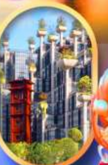
อาคาร 1,000 คัดไม้