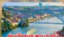
ล่องเรือชมสะพาน 6 แห่ง ในคูร์เมืองปอร์โต