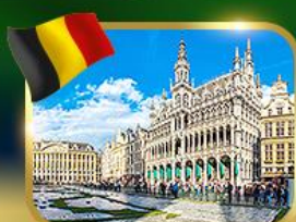
จัตุรัสกรอนด์ ปลาซ บรัสเซลส์