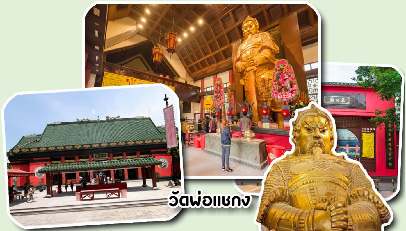
วัดพ่อแซงก

นำท่านเดินทางสู่ วัดแขก วัดที่ชาวฮ่องกงให้ความเลื่อมใสศรัทธามาเนิ่นนานสร้างขึ้นเพื่อระลึกถึงตำนาน นักรบแห่งราชวงศ์ซ่ง เทพเจ้าแซงก แม่ทัพปราบศึกที่กล้าหาญ ในกองทัพของท่านยามที่ออกรบเพื่อต้านข้าศึกศัตรูทุก ทิศทางทุกครั้งท่านจะใช้สัญลักษณ์รูปกังหัน 4 ใบพัด ติดไว้ด้านหลังรถศึกนำขบวนในกองทัพของท่าน ซึ่งท่านมีความ เชื่อว่าเมื่อพกพาสัญลักษณ์รูปกังหันนี้ไปณที่ใดๆกังหันนี้จะช่วยเสริมสิริมงคลนำพาแต่ความโชคดีมีอำนาจเข้มแข็งเสริม กำลังใจให้แก่กองทัพของท่านชื่อเสียงในการนำทัพสู้ศึกของท่านจึงเป็นตำนานมาจนทุกวันนี้