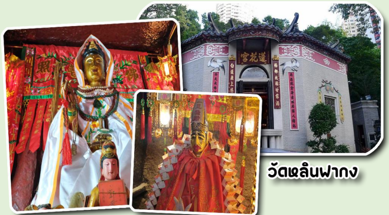
วัดหลินฟา

จากนั้นพาท่านเดินทางสู่ วัดหลินฟา (Lin Fa Kung Temple) หรือ วัดดอกบัว เป็นวัดที่อยู่บริเวณหว่านจ้าย ทางทิศตะวันออกเฉียงเหนือของคอสมเวย์เบย์ โดยวัดนี้จะถูกก่อสร้างในช่วงราชวงศ์ชิง หรือ ปี ค.ศ. 1963 มีการบูรณะอีกครั้งในปี ค.ศ 1986 และ 1999 มีเจ้าแม่กวนอิมเป็นองค์ประธานของวัด โดยมีตำนานเล่าว่า เจ้าแม่