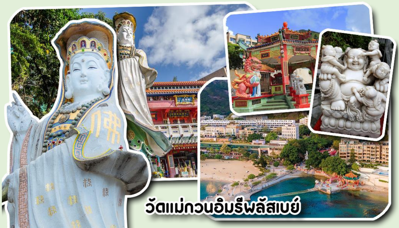
วัดแม่กวนอิมรีพลัสเบย์

จากนั้นนำท่านเดินทางกลับอ่องกงโดย สะพานข้ามทะเลที่ยาวที่สุดในโลก สะพานอ่องกง-จูไห่-มา เก้า เปิดใช้เมื่อวันที่ 24 ตุลาคม 2561 เวลา 9 โมงเช้า ใช้งบการสร้างกว่า 2 หมื่นล้านเหรียญสหรัฐ ซึ่งเชื่อมระหว่างจีนแผ่นดินใหญ่กับเขตปกครองพิเศษ อ่องกง จูไห่ มาเก๊า ซึ่งช่วยย่นระยะเวลาในการเดินทางจาก 3 ชั่วโมงเหลือแค่ 45 นาที จากนั้นพาท่านเดินทางต่อไปยัง วัดแม่กวนอิมริมหาดรีพลัสเบย์ วัดแห่งนี้ถูกสร้างขึ้นเพื่อคุ้มครองชาวประมงเวลาออก เรือไปหาปลาในสมัยก่อน บริเวณวัดมีสิ่งศักดิ์สิทธิ์มากมาย ได้แก่ เจ้าแม่กวนอิม ประดิษฐานอยู่ทางด้านซ้ายของวัด ซึ่งผู้คนนิยมเดินทางไปกราบไหว้ขอพรเรื่องการมีบุตร และยังมีพระสังกัจจายที่เชื่อกันว่าสามารถขอเพศของบุตรที่จะมาเกิดได้ โดยหลังจากกราบไหว้แล้วก็ให้ลูกที่ท้องของพระสังกัจจาย ถ้าอยากได้ลูกชายให้ลูบท้องซ้าย อยากได้ลูกสาวให้ลูบท้องขวา ถัดมาคือ เจ้าแม่ทับทิมเทพีแห่งท้องทะเล ท่านจะคอยคุ้มครองผู้เดินทางทางเรือ หรือผู้ที่เดินทางไปไหนมาไหนท่านจะคอยคุ้มครองให้ปลอดภัย และมีโชคลาภ ถัดจากบริเวณที่กราบไหว้ขอพร ก็จะมีศาลาแปดเหลี่ยมริมน้ำ และสะพานเล็กๆ ที่ชื่อว่าสะพานต่ออายุ ซึ่งเชื่อกันว่าหากเดินข้ามสะพานแห่งนี้ 1 ครั้ง ก็จะมีอายุยืนขึ้น 3 ปี