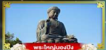
พระใหญ่ของปิง