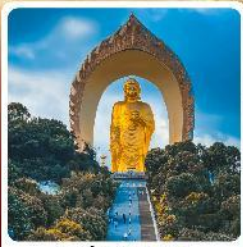
พระใหญ่ตงหลิน