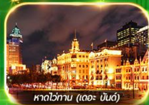
หาดไข่มุก (เดอะ บันด์)

เที่ยวมหานครเซี่ยงไฮ้ ถ่ายรูปเช็คอินท์ Tian An 1000 Trees, ซินเทียนตี้ ช้อปปิ้งตลาดเงินหวงเหมียว, ถนนนานกิง