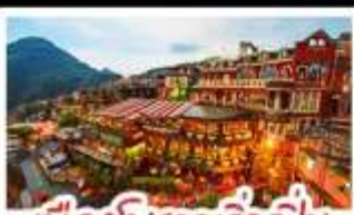
เมืองโบราณจิวเฟิ่น

ฟาร์มแกะซิงจิง - ทะเลสาบสวี่นจินทรา จิวเฟิ่น - หมู่บ้านประมงหลากสี - ไทเป 101 หมู่บ้านสายรุ้ง - ตลาดล่าหู่ & ซีเหมินติง ปลาประ-ธานธิบดี - เขียวหลงเป่า