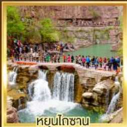
หยุ่นโกซาน