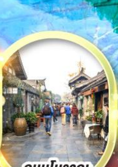
ถนนโบราณ ชอยกั้วจั้งชอยแคบ