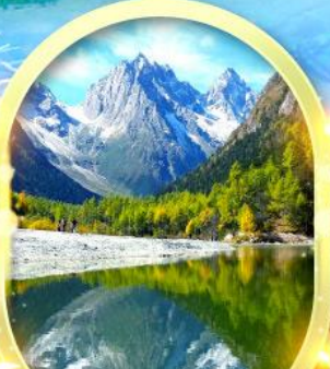
อุทยานปี้ฝิงโกว