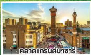
ตลาดแกรนด์บาซาร์