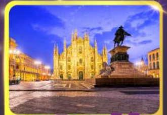
มหาวิหารคูโอโม