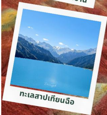
ทะเลสาปเทียนฉือ