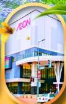
อีออนมอลล์