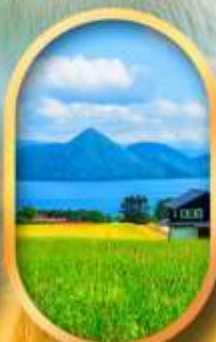
ทะเลสาบโทโยะ