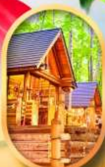
บึงเทิลเกออส