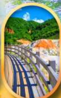
โนโบริเบทสึ