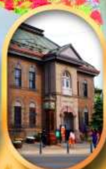
พิพิธภัณฑ์กล่องดนตรี