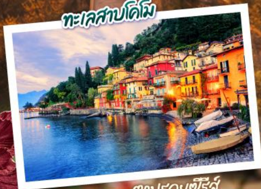
ตามรอยซีรีส์