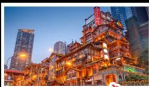
ตลาดแดงเขาดัง