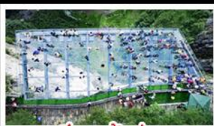
ระเบียงแก้วอยู่เพลง