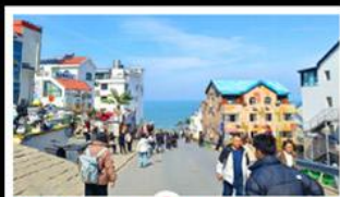
ถนนคอปเพิลิงหมายเลข 8

สัมผัสความยิ่งใหญ่ของ 4 เมืองสำคัญ ชิงเต่า - เยียนโก - เฟิงไห่ - เว่ยไห่ ปาด้ากวน - โบสถ์คาทอลิก - ตึกเก่าริมหา