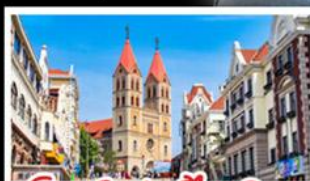
โบสถ์เซนต์ไมเคิล