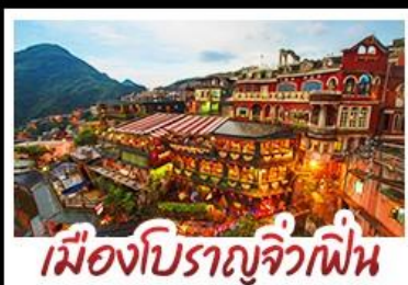
เมืองโบราณจิวเฟิน