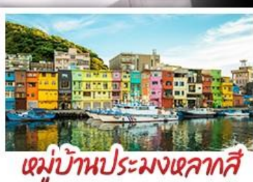
หมู่บ้านประมงเหลากสี