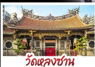
วัดเจหลงซาน