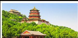
พระราชวังฤดูร้อนอีเหอหยวน

บ๊อพิศษ เปิดปักกิ่ง สุกิมองโก MICHELIN GUIDE ร้าน TAO TAO JU