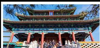
สวนจิ่งอัน