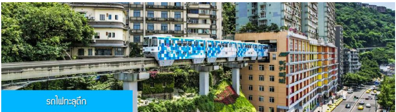
รถไฟทะเลตุ๊ก