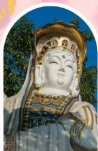
ริพลัสเบย์ รับพลังงานดี เสริมพลังดวงจัญ