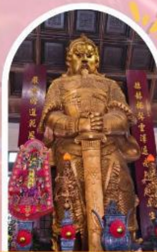
วัดแซกง ขอพรโชคกลาง การเงิน และธุรกิจ