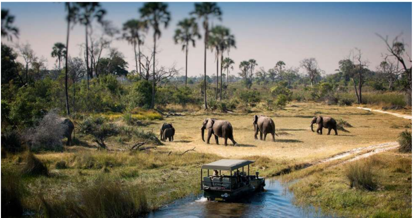
วันหยุดที่ดีที่สุดที่ 6 สิงหาคม 2569 Chobe National Park Botswana - Zambezi Sundowner cruise