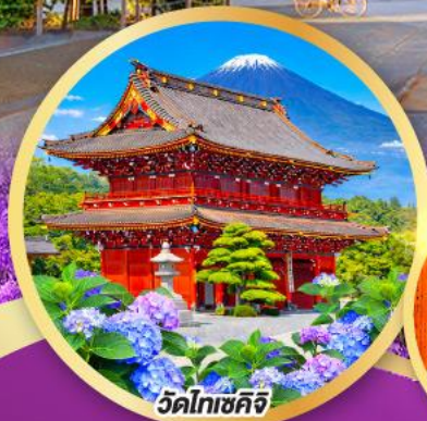
วัดโทเซคิจิ