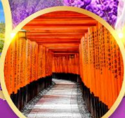
ศาลเจ้าฟุชิมิอินาริ