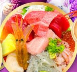
ตลาดปลาฮิมิสึ คาชิโนะอิชิ