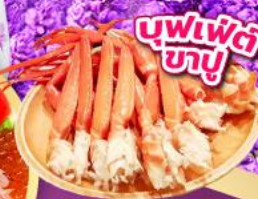
บุฟเฟ่ต์ ซาซึ