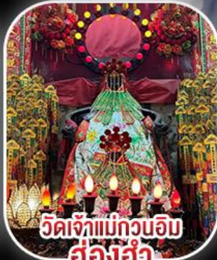
วัดเจ้าแม่กวนอิม ฮ่องฮำ