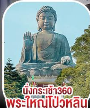
นั่งกระเช้า360 พระใหญ่โป้วหลิน