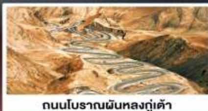
ถนนโบราณผืนหลงกู่เต้า