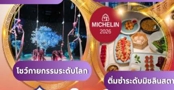
โชว์กายกรรมระดับโลก