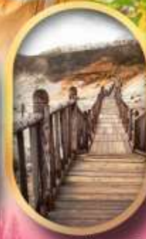
หุบเขาจิกุกาชิ