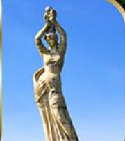
จูไห่ฟิชเชอร์เก็สรา