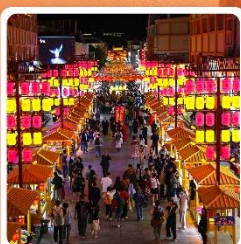
ตลาดกลางคีนซาโจว