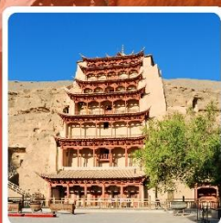
กำมั่วเกาตุ