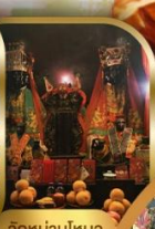
วัดบ้านใหม่