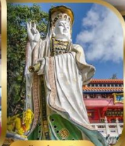
เจ้าแม่กวนอิม ริพลีสเบย์