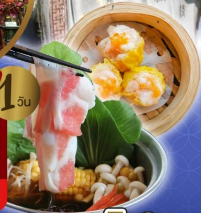
เจ้าแม่กวนอิม ริพลีสเบย์