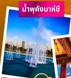
น้ำพุคังบาร์ซี