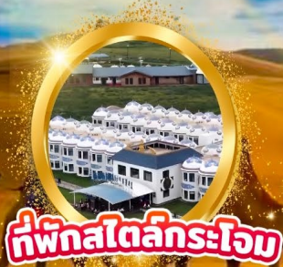
ที่พักสไตล์กระทิง