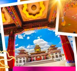
วัดโพธิสัตว์อุลาน