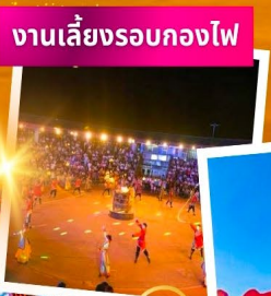
งานเสี่ยวรอบกองไฟ