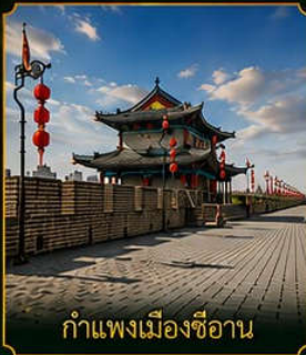
กำแพงเมืองซีอาน