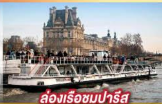
ล่องเรือชมปารีส