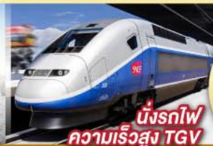
นั่งรถไฟ ความเร็วสูง TGV