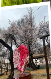
สวนแอปริคอต