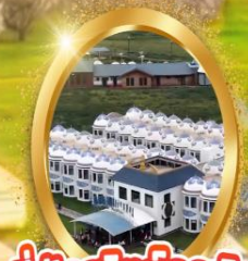
ที่พักสไตล์จีนระยอง