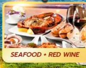
SEAFOOD + RED WINE