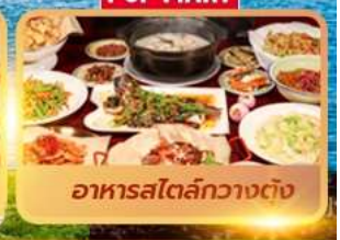
อาหารสไตล์กวางตุ้ง