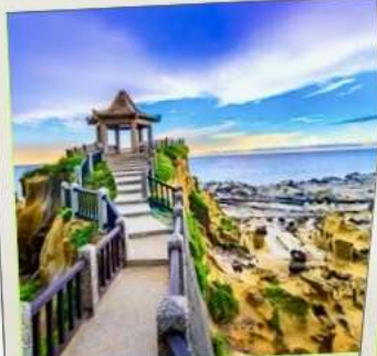
อุทยานเกาะเหอผิง