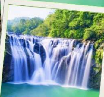
น้ำตกสีเฟิน