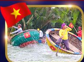
ล่องเรือกระด้ง หมู่บ้านกัมกาน