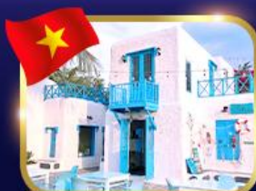
คาเฟ่สไตล์ซานโตรินี่ ชันทรา มารีน่า