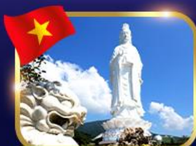
ขอพรองค์กวนอิม วัดหลินอ๊ว