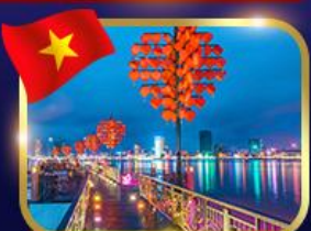
สะพานแห่งความรัก ดานัง