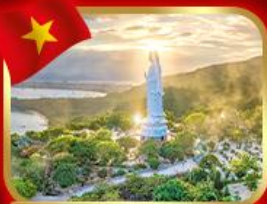
ขอพรกวอนอิม วัดหลินอึ้ง