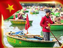
เรือกระด้ง หมู่บ้านกิมทาน