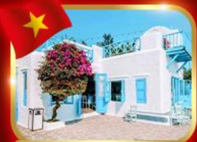
คาเฟ่สุดชิค ซานทรา มารีน่า