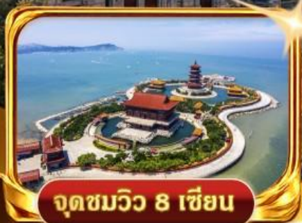
จุดชมวิวกว 8 เซียน