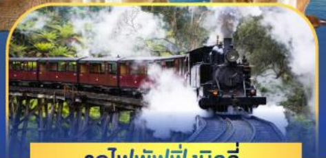
รถไฟพัพฟิงบิลลี่

ล่องเรือชมอ่าวซิดนีย์พร้อมรับประทานอาหารกลางวัน และ เข้าชมสวนสัตว์การองก้า