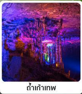
ดำเก้าทพ