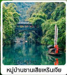
หมู่บ้านซานเสี่ยเหรินเจีย